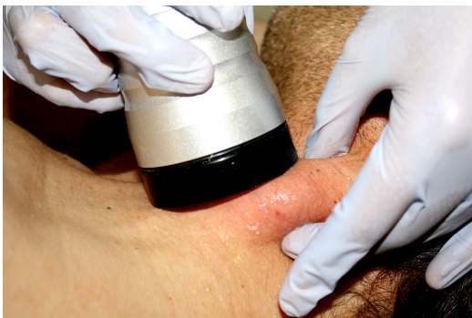
Fig.3: trattamento del lipoma con ultrasuoni