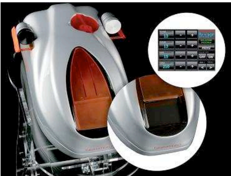
Fig. 1: Cavitation II (Re-age)

Prima di iniziare il trattamento l'area stabilita viene ricoperta con gel di conduzione.