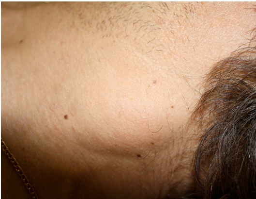
Fig.2: lipoma del collo

Abbiamo valutato anche l'efficacia dello strumento di cavitazione Cavitation (Re-age) misurando l'area trattata con gli ultrasuoni e valutando la riduzione di volume o rilevando la variazione lineare dell'area o dell'accumulo di grasso (lipoma) trattato.